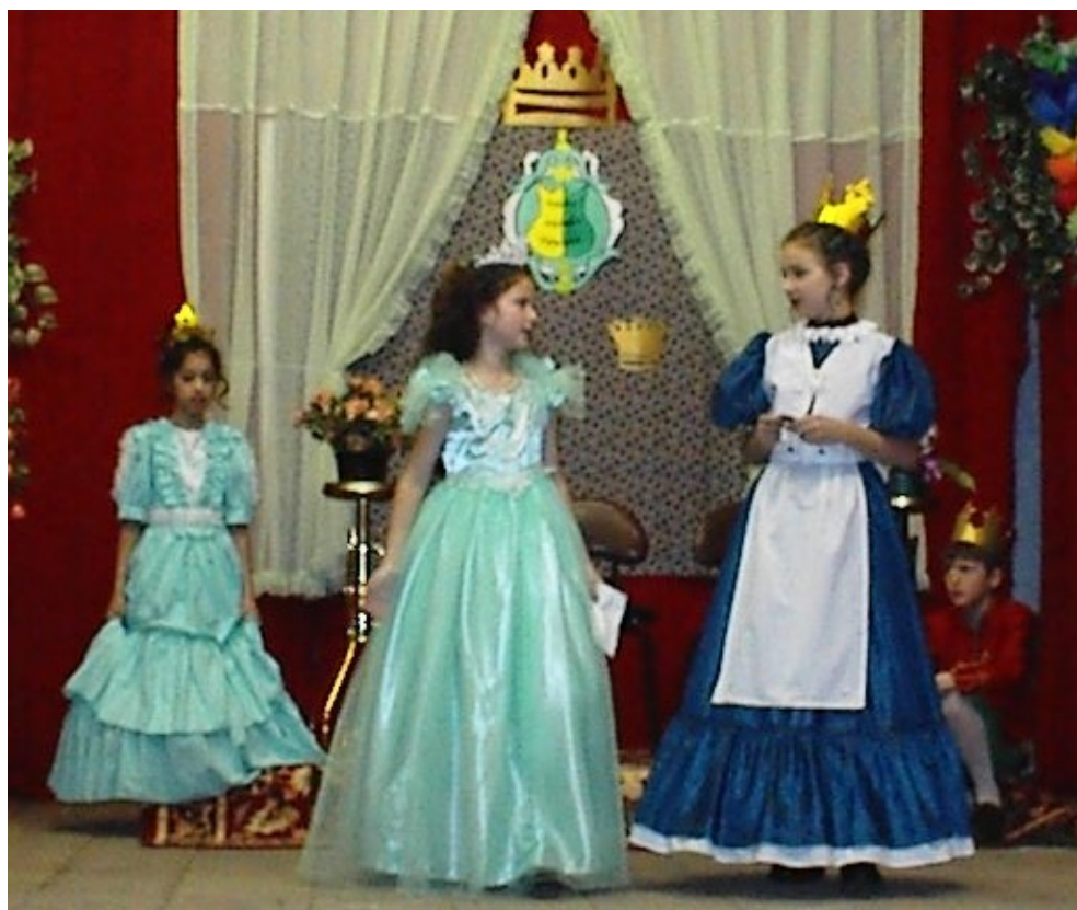
Jelenet a széchenyis alsós farsangból