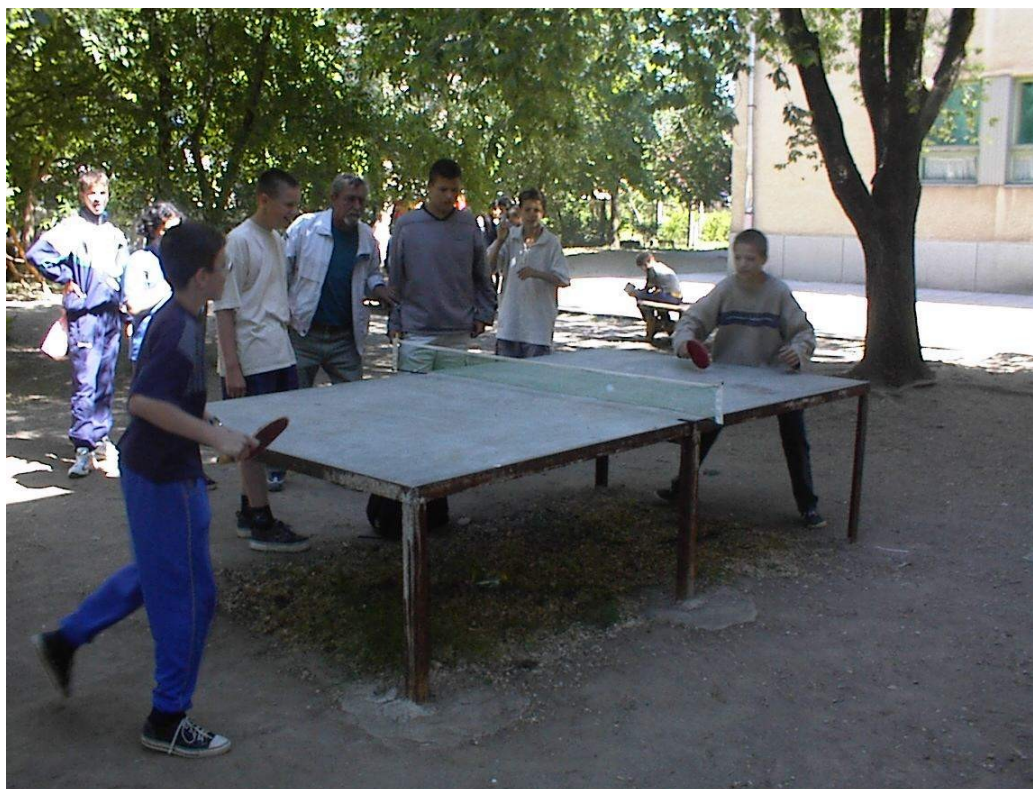
A mérkőzés heve