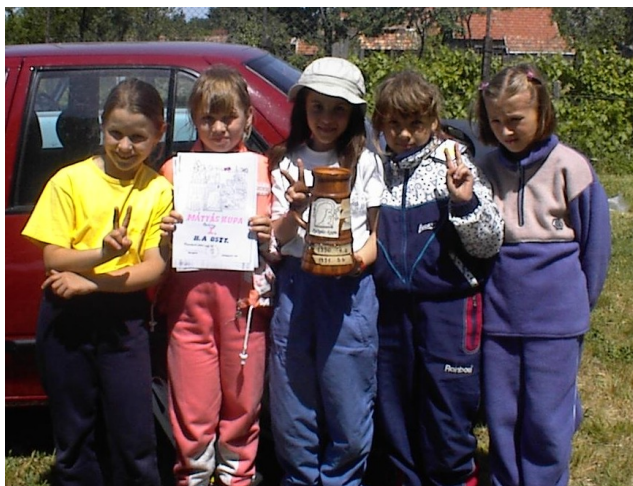
A Mátyás-kupa győztesei