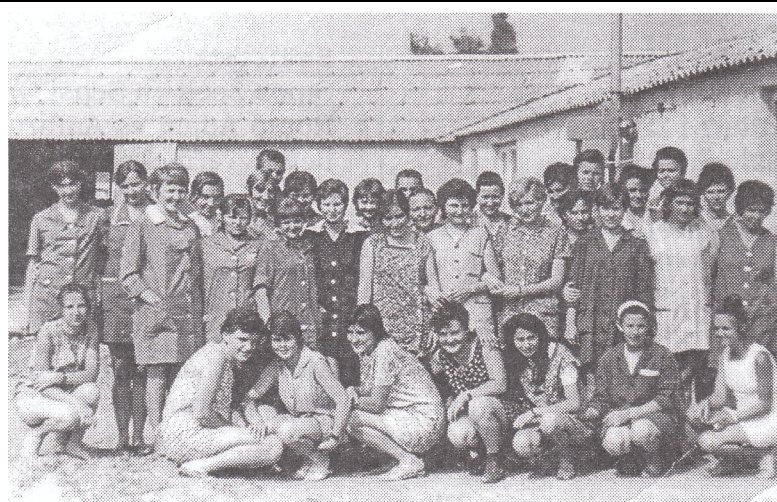
Az első 30 asszony

futballistákat a meccsek helyszínére, mezeket vásárolt nekik. A szocialista brigádok patronálták az iskolát, pl. részt vettek a faház építésében. A munkásainak a mai napig emlékeztetése a közös kirándulások, a május elsejék. 1989-ben a MINO piacvesztésre kényszer